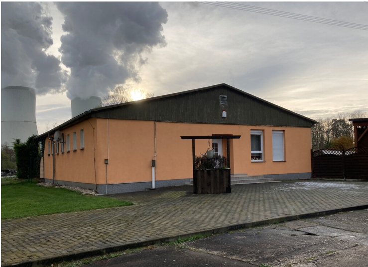
Sozialgebäude mit Blick Richtung Südwesten