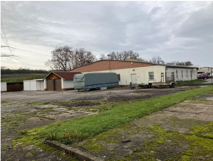
südliche Werkhalle mit Blick Richtung Nordwest