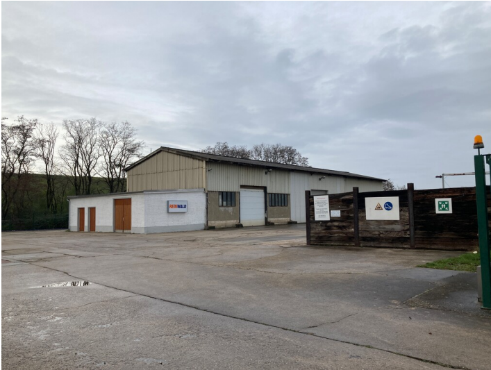
Halle aus mit Blick nach Nordwest