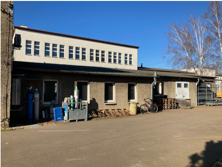
Werkstatt und Lager aus südlicher Richtung