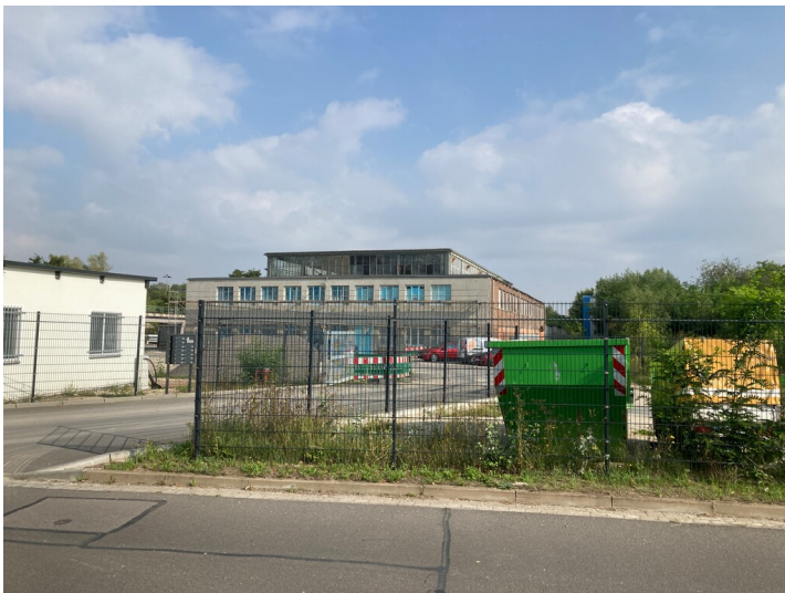
Hauptwerkstatt aus südlicher Richtung