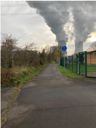
mit Blick Richtung Süden