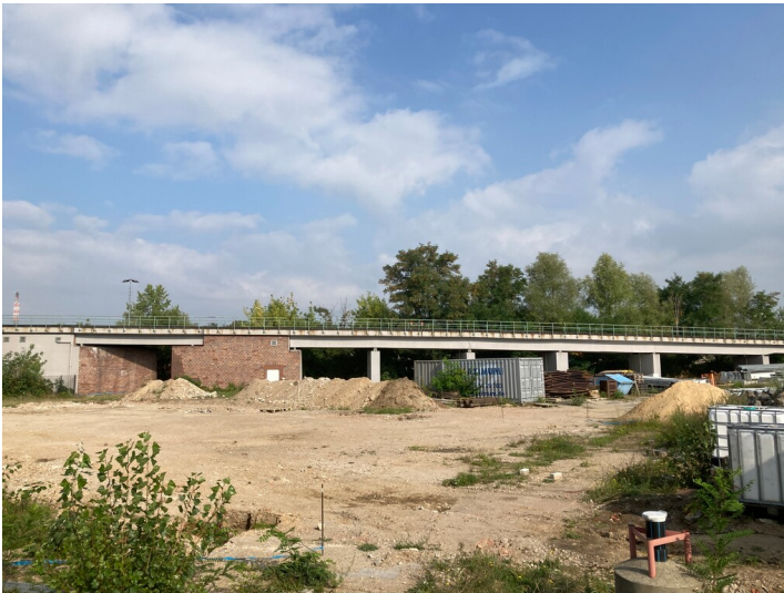
Millionenbrücke über der Werkstraße