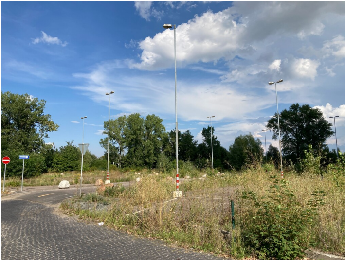
Busplatz am Rundteil