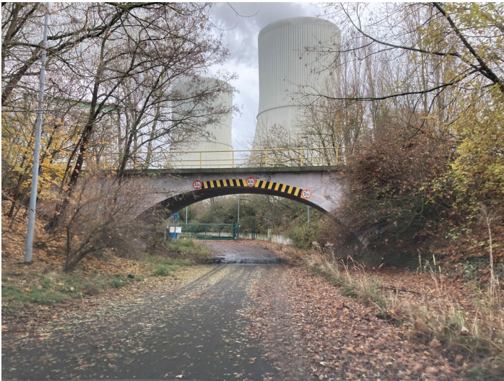
Bogenbrücke mit Wegeunterführung von Norden