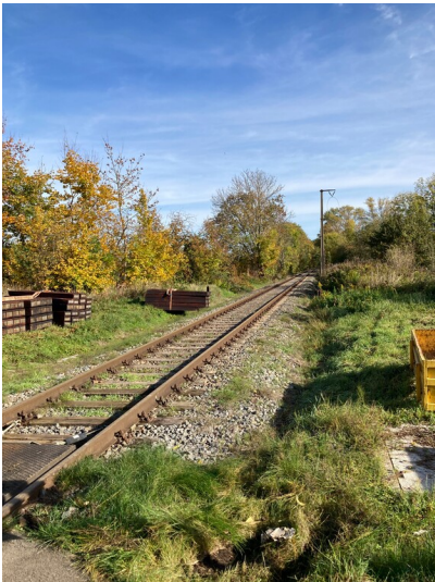
Eisengangleise zwischen Böhlen und Rötha