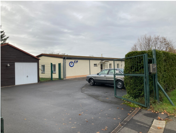
Gebäude mit Blick in Richtung Nordwest