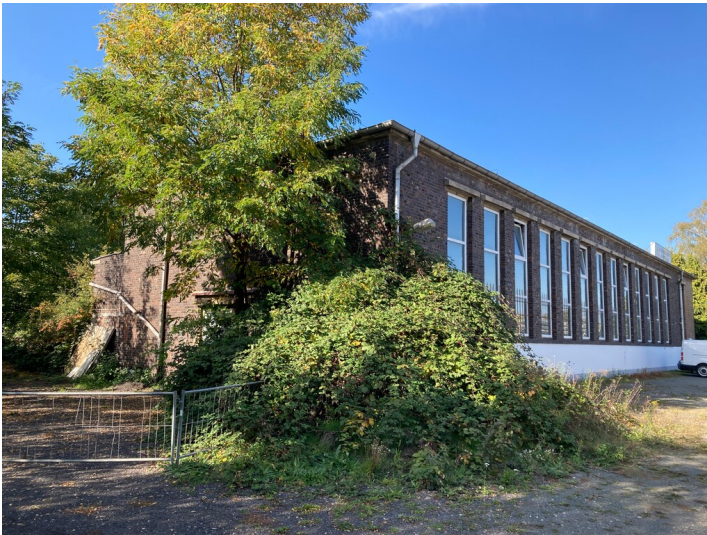
Gleichrichterstation von Südost