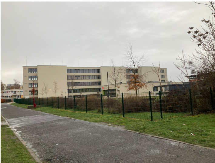
Blick auf die Schule aus nordöstlicher Richtung