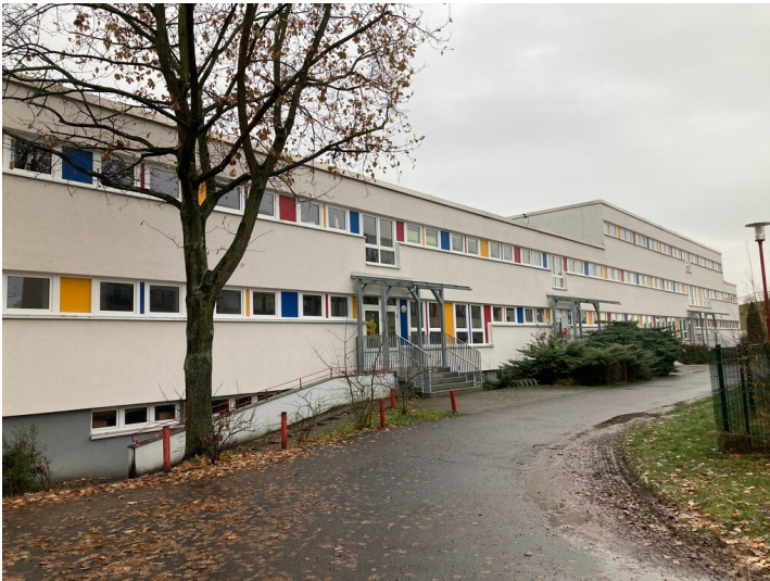
Kinderkombination aus nordöstlicher Richtung