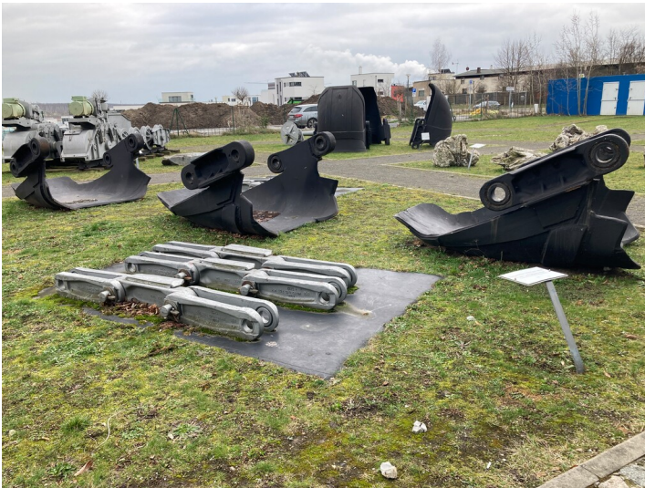
Außenausstellung am Ausstellungspavillon Kap Zwenkau (im Vordergrund Flach- und Dickscharfen sowie Baggereimer dahinter)