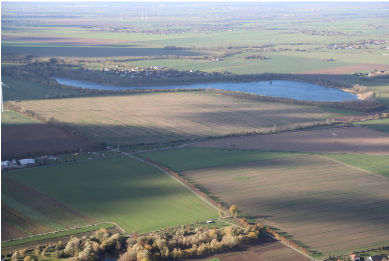
Luftbild vom Werbener See aus südwestlicher Richtung