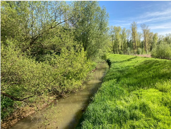
Verlegung der Wyhra östlich von Großzössen