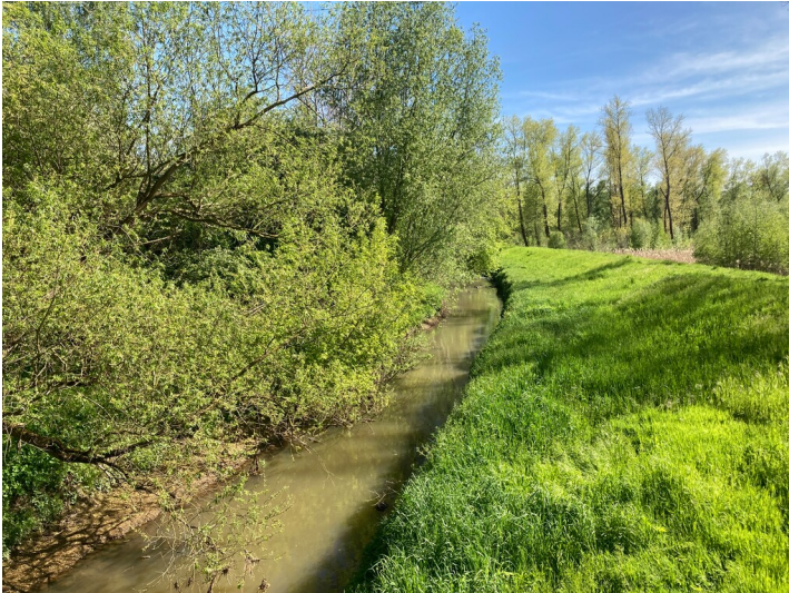
Verlegung der Wyhra östlich von Großzössen