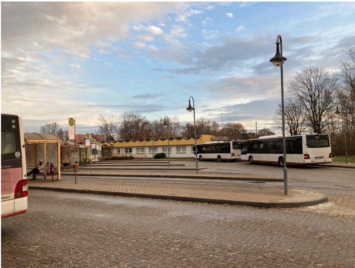
Busbahnhof Borna mit Verwaltungsgebäude, Blick vom Bahnhofsvorplatz in westliche Richtung