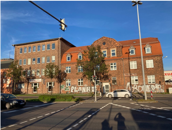
VTA-Verwaltungsgebäude, ehemaliges Beamtenwohnhaus mit Blick in Richtung Osten