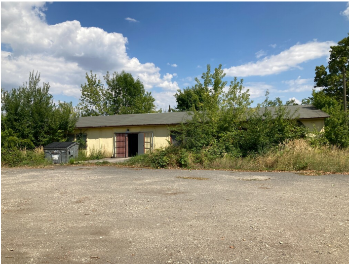
Bürogebäude mit Sicht auf die Westseite des Gebäudes