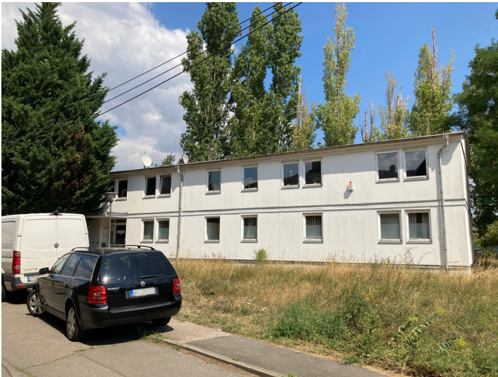
Bürogebäude gegenüber des Kopfbaus des historischen Fabrikkomplexes, Blick auf westliche Gebäudeseite