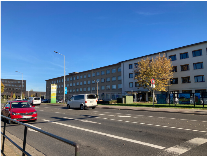
Bürogebäude der ersten Bauphase des Instituts für Energetik mit Blick Richtung Südost