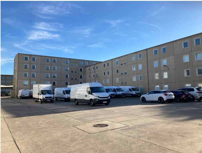
Interpretationsgebäude des VEB Geophysik Leipzig von Northwest