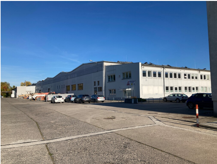
Kompaktbau des VEB Geophysik Leipzig von Nordost