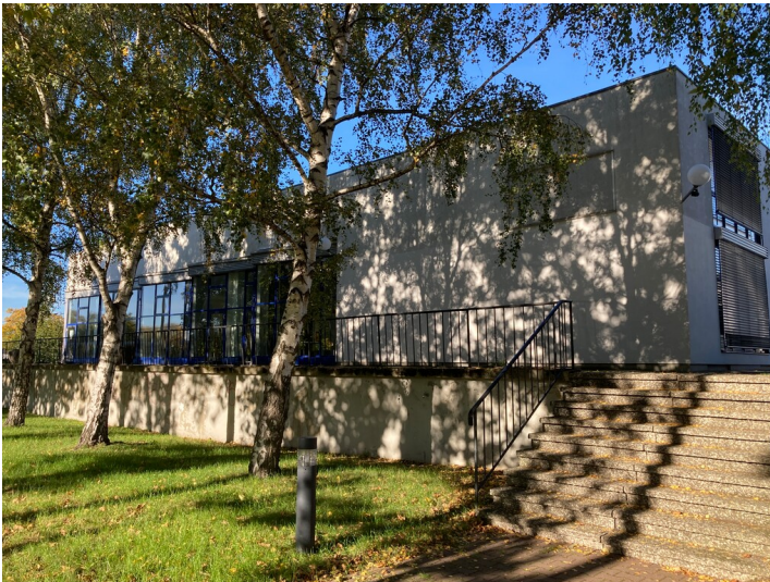
Sozialgebäude des VEB Geophysik Leipzig an der Bautzner Straße von Nordost