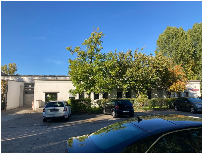
Zentrale Rechenstation des VEB Geophysik, errichtet als Zentrallager, von Süden