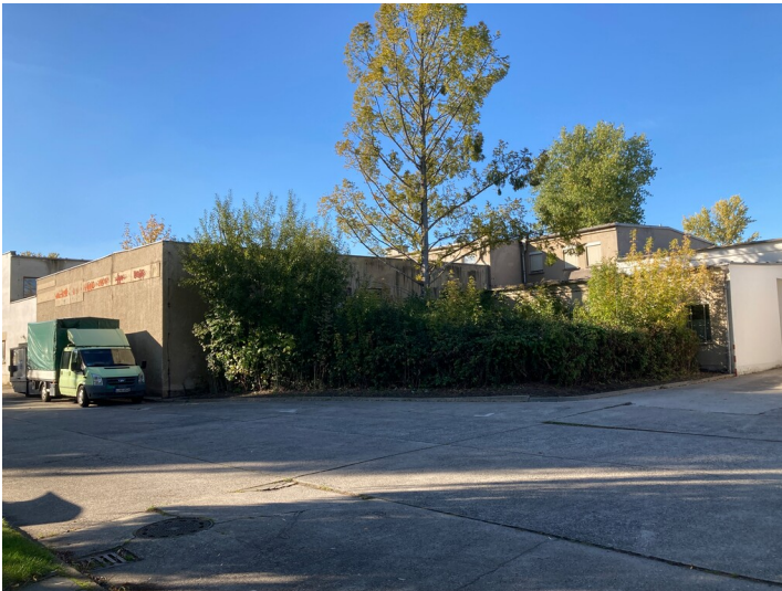
Garagenblock D des ehemaligen VEB Geophysik, mit zahlreichen Anbauten versehen, von Süd