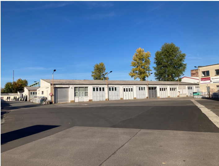
Garagenblock C des ehemaligen VEB Geophysik von Süd