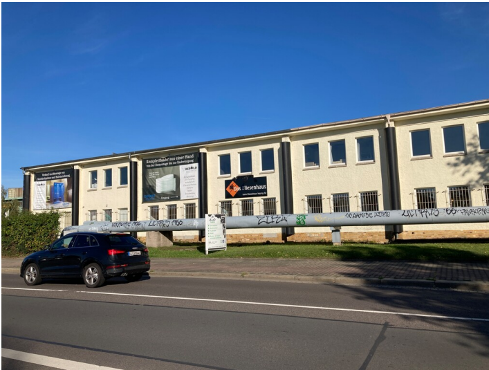
ehemalige Werkstatthalle des VEB Geophysik von Osten