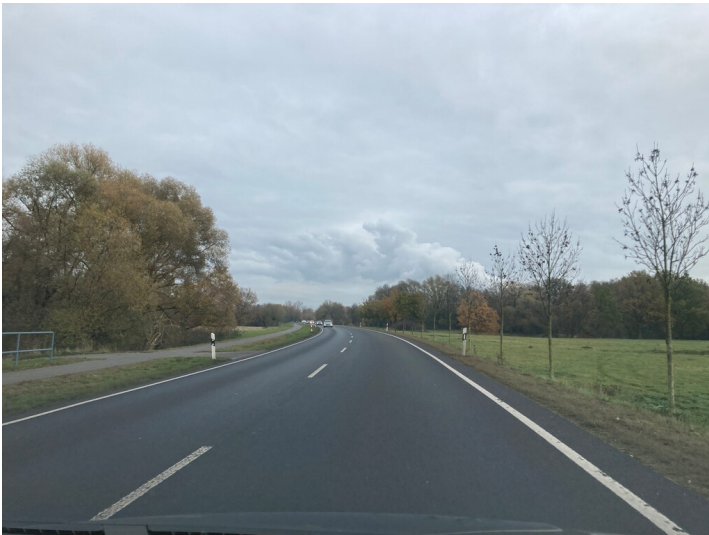
B 186 bei Imnitz