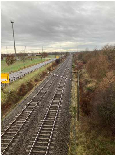
Eisenbahnstrecke bei Rödingen mit Blick Richtung Süden