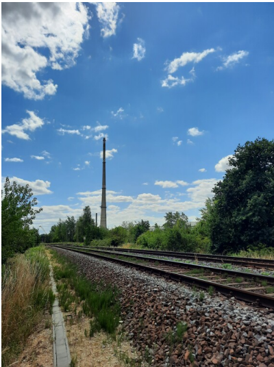
Eisenbahnanlage, Eisenbahnstrecke Zeitz-Leipzig