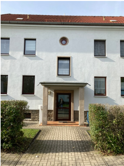
Detail Wohnblock Bergmannstraße