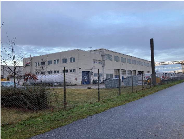
Werkstatt für Hilfsgerätetechnik mit Blick in nordwestliche Richtung