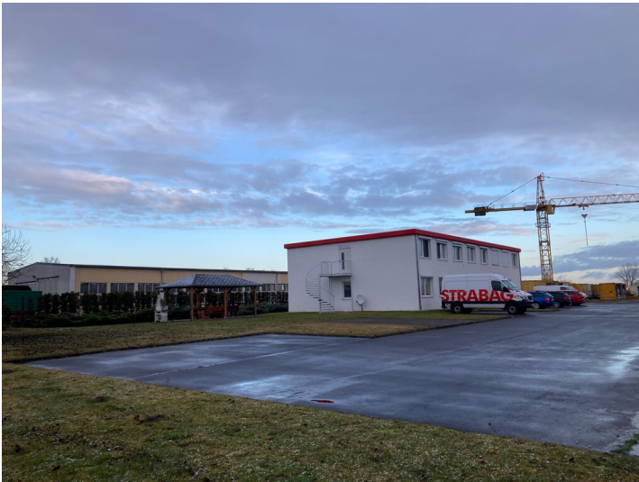
Vulkanisierwerkstatt mit Blick Richtung Nordwest (Gebäude im Hintergrund)