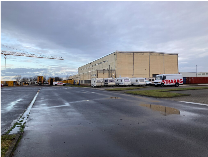
Elektrowerkstatt der Breitenfelder Tagesanlagen mit Blick in Richtung Nordost