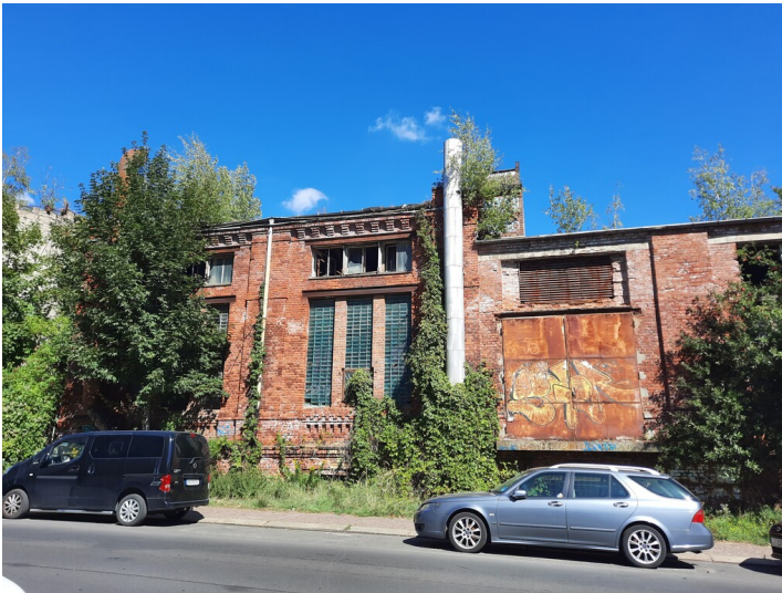
Gebäudestufe zwischen Turbinenhaus Schaltzentrale aus südlicher Richtung