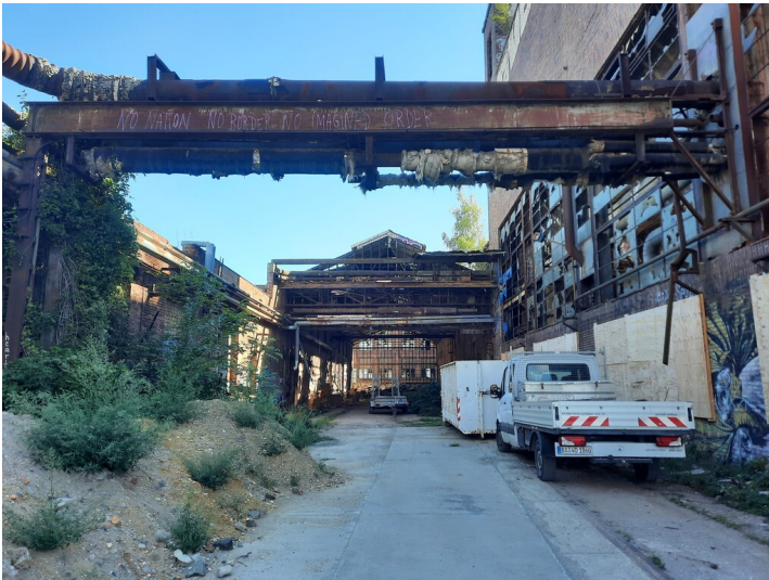
Blick auf die Gleishalle im Hintergrund