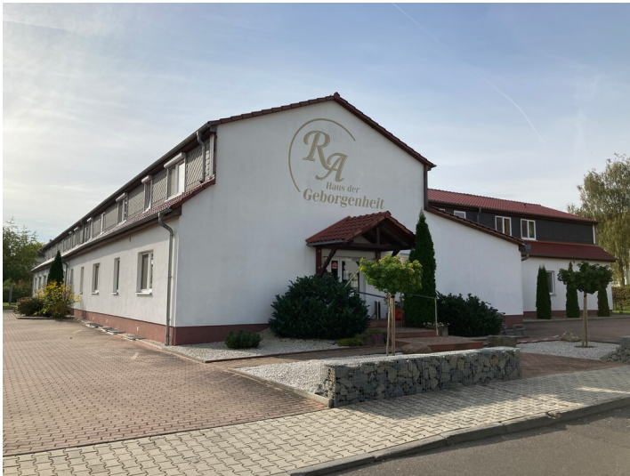
Kinderkrippe aus nördlicher Richtung