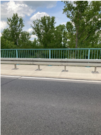
Straße und Straßenbrücke zwischen Wolteritz und Hayna