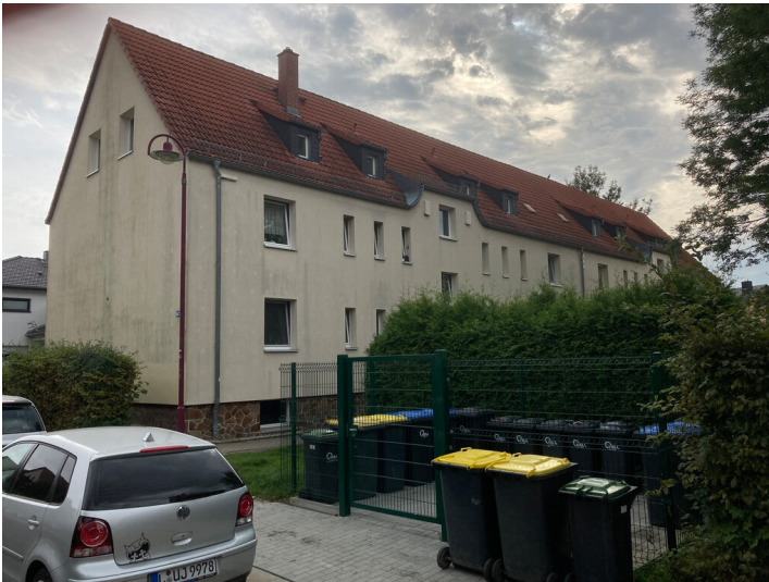
Blick auf ein Siedlungshaus Typ A aus nordwestlicher Richtung