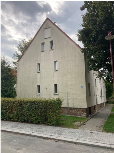
Siedlungshäuser Typ B; Siedlung Neuwitznitz