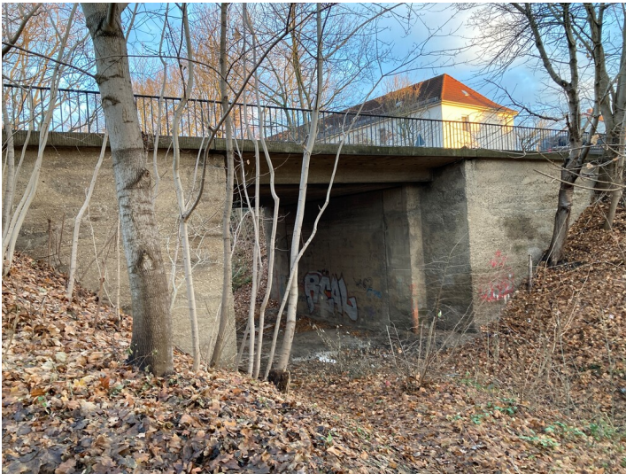
Straßenbrücke über die Witznitzer Kohlenbahntrasse, Röthaer Straße, fotografiert von der Stadionseite

Schlagwörter: Straßenbrücke Fachsicht(en): Denkmalpflege Gemeinde(n): Borna Kreis(e): Leipzig Bundesland: Sachsen