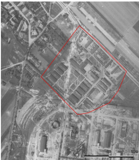
Gemeinschaftslager Pulgar, Zwangsarbeitslager (Kartengrundlage: Historic Environmental Scotland/National Collection of Aerial Photography - : ""NCAP-000-001-117-878, Pulgar, 1944"". 2023)