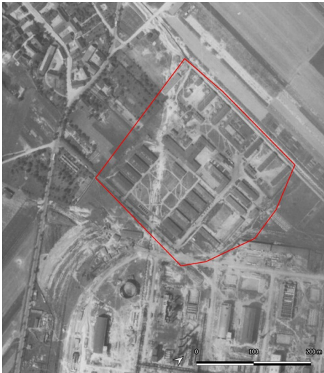
Gemeinschaftslager Pulgar, Zwangsarbeitslager (Kartengrundlage: Historic Environmental Scotland/National Collection of Aerial Photography - : ""NCAP-000-001-117-878, Pulgar, 1944"". 2023)