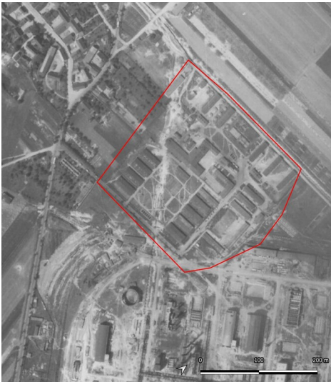
Gemeinschaftslager Pulgar, Zwangsarbeitslager