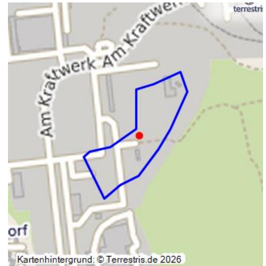
Lager I, II, III Lippendorf (Kartengrundlage: Bergholtz, Detlef/Reichel, Andrea: Höhensonne und Alpenrose. Die Arbeitserziehungslager Lippendorf und Peres in der Zeit des 2. Weltkrieges und der Leidensweg niederländischer Zwangsarbeiter, hg. von Heimatverein Lippendorf-Kieritzsch und Umgebung e.V. Neukieritzsch 2012, 30. )

1939 richtete die Aktiengesellschaft Sächsische Werke (ASW) im Rittergut Lippendorf ein Kriegsgefangenenlager für 100 polnische Soldaten ein. Das Lager wurde im Laufe des Krieges um 15 Baracken erweitert (Lippendorf I-III). Hier waren Häftlinge aus Frankreich, Belgien, den Niederlanden, Italien und der Sowjetunion sowie aus Deutschland untergebracht. Die Menschen mussten Zwangsarbeit in den umgebenden Tagebauen und im Kraftwerk verrichten. Heute liegt die Fläche brach und ist zum Teil vom alten Kraftwerk Lippendorf überbaut worden. Davon sind heute noch das Hauptpumpenhaus und die Reinigungsbecken erhalten. Vom alten Barackenlager sind wahrscheinlich nur noch wenige Reste im Boden erhalten.