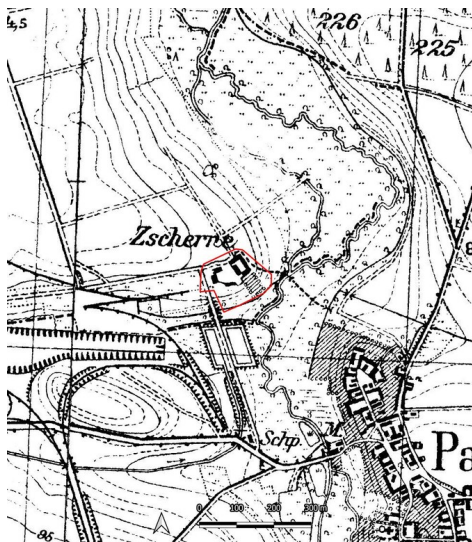
Devastierter Ort: Zscherne (Vorwerk Petersroda), Messtischblatt 1935 (Kartengrundlage: GeoSN, dl-de/by-2-0.; Historische Karten (Messtischblatt vor 1945). 2023.)