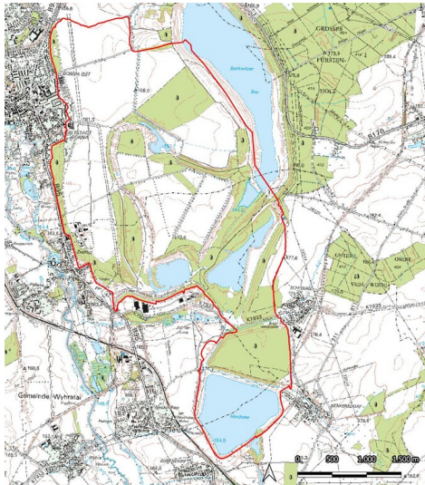
Tagebau Borna-Ost (Kartengrundlage: GeoSN, dl-de/by-2-0.: Historische Karten (TK25 ab 1990) Fotograf/Urheber: Ullrich Ochs