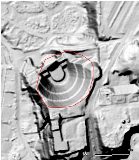
Die Grube am Breiten Teich, Borna (Kartengrundlage: GeoSN, dl-de/by-2-0.: DGM1 Sachsen, 2023.)