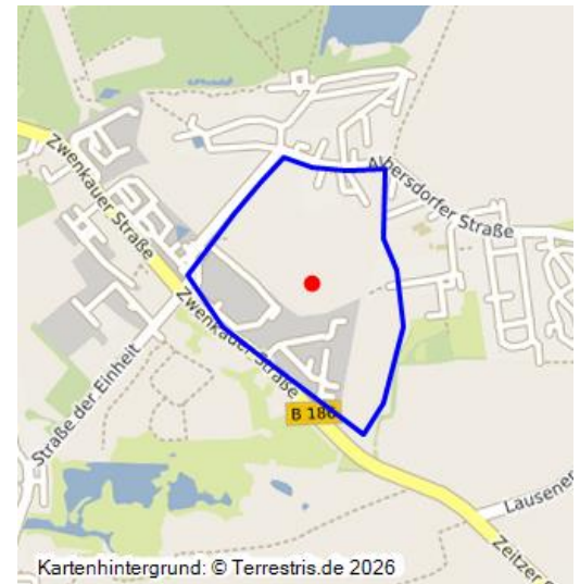
Glück auf Schacht, Kulkwitz (Kartengrundlage: Sächsische Landesbibliothek - Staats- und Universitätsbibliothek / Deutsche Fotothek: TK (Äquidistantenkarte) Sachsen, Section Zwenkau, 1879.)

1881 wurde am Ostrand der Kulkwitzer Flur der „Glück auf Schacht“ abgeteuft und ist als Fortsetzung der Grube Gewerkschaft Mansfeld (30400082) zu verstehen. 1882 verband man den Schacht durch ein Gleis mit dem Bahnhof in Markranstädt. Ab 1890 wurde in den Schachtanlagen eine elektrische Beleuchtung installiert. 1896 legte man den Schacht still. Das Schummerungsbild des digitalen Geländemodells zeigt ein großes Bruchfeld, das allen Seiten durch die anliegenden Straßen abschließt. Ein Großteil der Fläche wird heute landwirtschaftlich genutzt. Dort zeichnen sich die Brüche noch relativ gut ab. Die Tagesanlagen sind mit modernen Industrieanlagen überbaut.