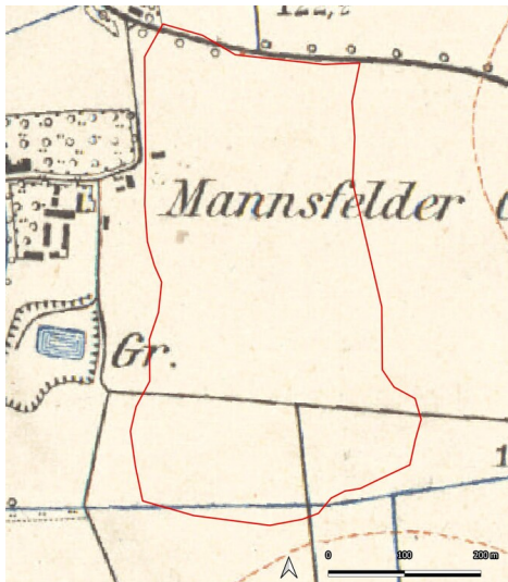
Gewerkschaft "Grube Mansfeld", Albersdorf (Kartengrundlage: Sächsische Landesbibliothek - Staats- und Universitätsbibliothek / Deutsche Fotothek: TK (Äquidistantenkarte) Sachsen, Section Zwenkau, 1879.)